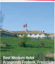
Best Western Hotel Kronprinds Frederik, Fredericia