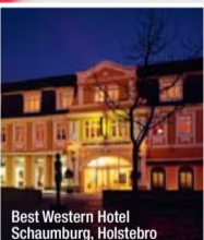
Best Western Hotel Schaumburg, Holstebro