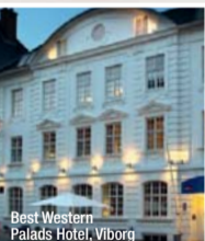
Best Western Palads Hotel, Viborg