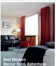
Best Western Mercur Hotel, København