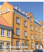
Best Western Hotel Jens Baggesen, Korsør