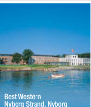
Best Western Nyborg Strand, Nyborg