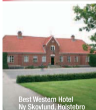
Best Western Hotel Ny Skovlund, Holstebro

Her er et udvalg af vores 26 Best Western hoteller i Danmark